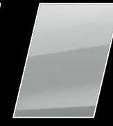
Blanco Perlado (089)