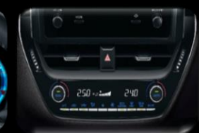
Aire acondicionado Bi-zona