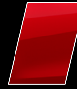
Rojo Mica Metálico (3R3)