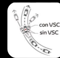
Control de estabilidad del vehículo VSC