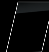
Negro mica (209)