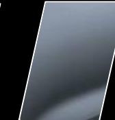
Gris azulado (1K3)