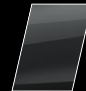
Gris Metálico (1G3)