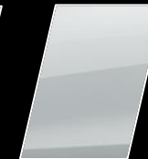
Super Blanco II (040)