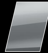
Plata Metalizado (1E7)