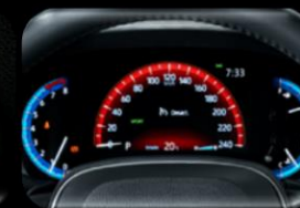
Pantalla multifuncional 7"